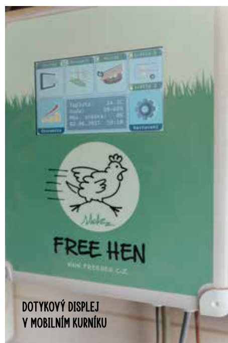
DOTYKOVÝ DISPLEJ V MOBILNÍM KURNÍKU