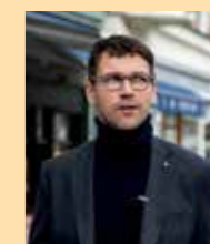
LUKÁŠ HEJLÍK herec, moderátor a gastronomický nadšenec