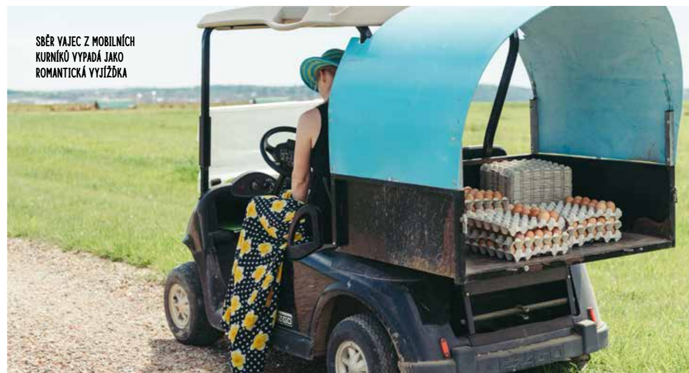
SBĚR VAJEC Z MOBILNÍCH KURNÍKŮ VYPADÁ JAKO ROMANTICKÁ VYJÍŽDKA