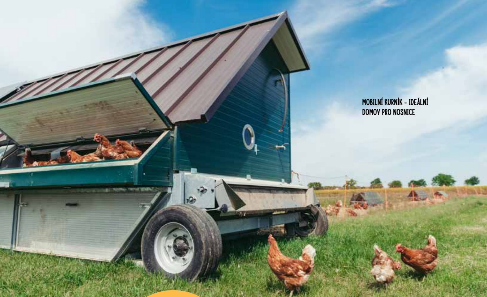
MOBILNÍ KURNÍK - IDEÁLNÍ DOMOV PRO NOSNICE